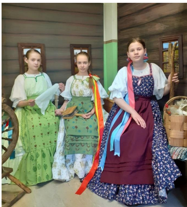
Экспозиционно-выставочное пространство «Крестьянская изба»

На фото участницы музейно-образовательной программы «Школа ремёсел» во время открытого занятия «Традиционные ремёсла Русского Севера конца XIX века» 2018 год