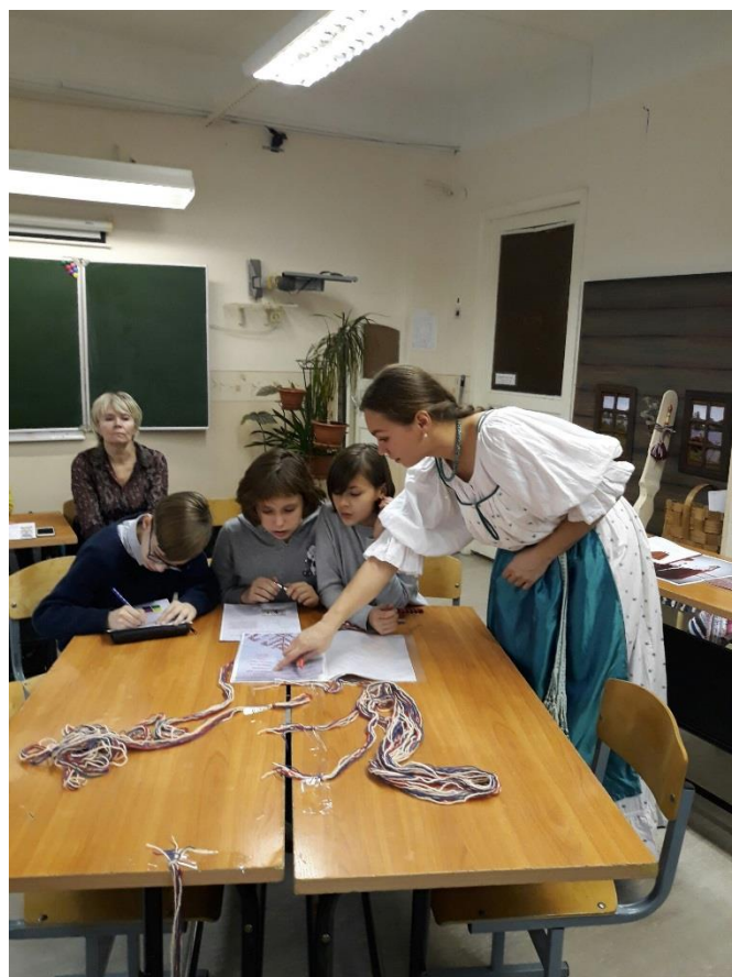
Заполнение маршрутных карт во время открытого конкурсного занятия «Женские ремёсла в традиционной культуре Русского Севера» 12 декабря 2017 года