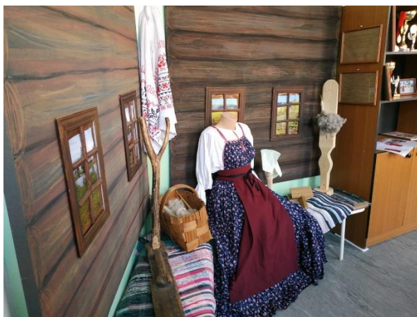
Экспозиционно-выставочное пространство «Крестьянская изба»

Добро пожаловать в интерактивное музейно-образовательное пространство школы № 641!