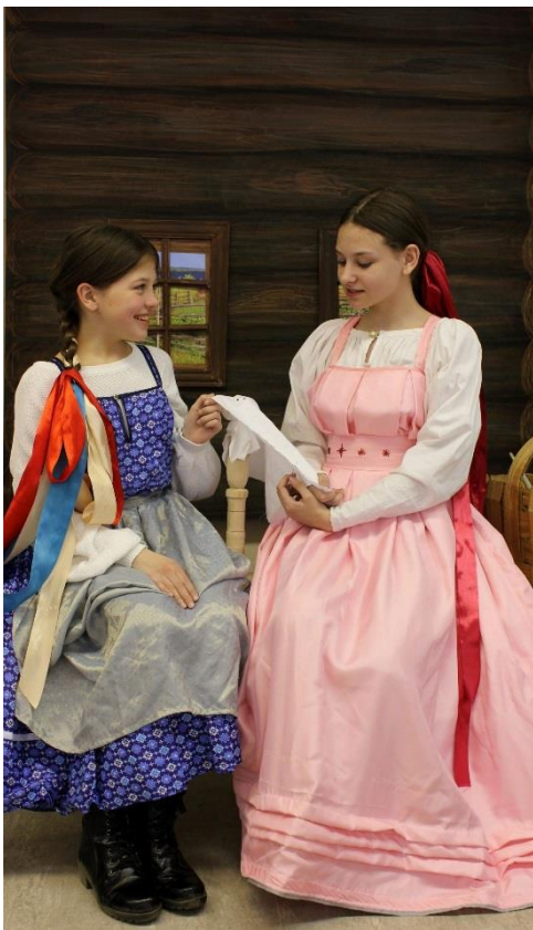
Обучающиеся демонстрируют принцип работы на швейке во время открытого конкурсного занятия