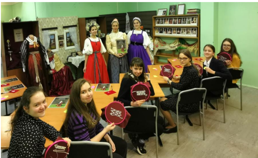
Участницы открытого конкурсного занятия «Традиционный женский костюм Русского Севера XIX – XX веков» и мастер-класса по изготовлению жемчужной сетки-поднизи 7 декабря 2020 года