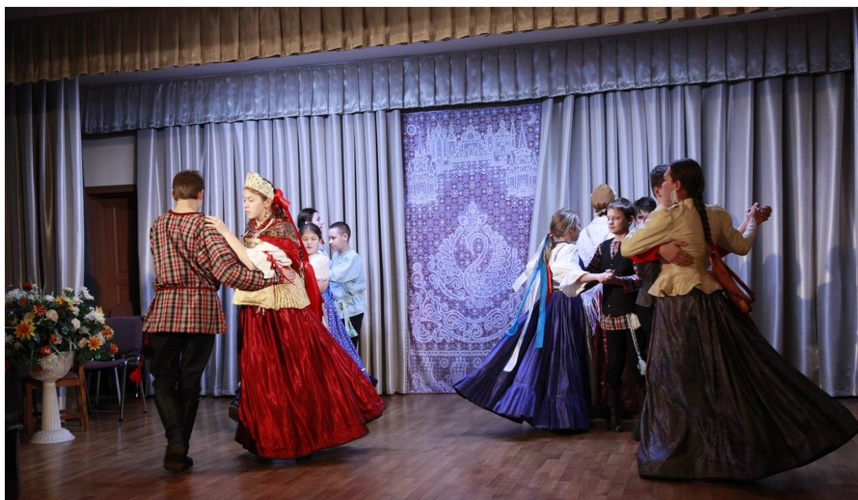
Участники программы «Этнография в танце» в составе ансамбля национального танца «Заонежская беседа» на Всероссийском конкурсе-фестивале народного искусства «Малахитовая шкатулка - 2017» исполняют традиционный танец жителей берегов Онежского озера XIX века «Кадриль заонежская, фигура первая» г. Санкт-Петербург, Россия Диплом I степени

Знакомясь через танец с культурой своего/близкого народа, дети проникаются уважением к его традициям. Знакомясь с народным танцем, дети одновременно соприкасаются с традиционным культурным наследием народа, с фольклором, который своей сущностью развивает и воспитывает как личность отдельно взятую, так и коллектив в целом. Дети изучают обряды, праздники народного календаря, народные игры, активно включаются в постановки фольклорных праздников, в организацию выездных концертов, в создание и оформление декораций, сценических костюмов.